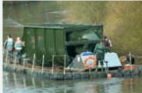
1900 l/s 1,70 m 24,00 kW