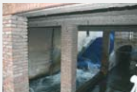
3100 l/s 2,10 m 47,00 kW