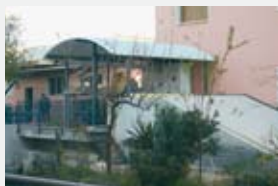
2760 l/s 1,35 m 27,50 kW