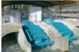
2000 l/s 1,00 m 14,60 kW