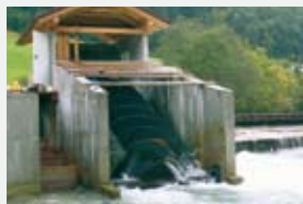
3000 l/s 1,90 m 40,70 kW