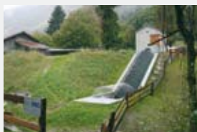
700 l/s 6,00 m 30,60 kW