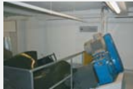
2800 l/s 1,50 m 30,50 kW