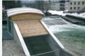
2000 l/s 2,50 m 36,50 kW