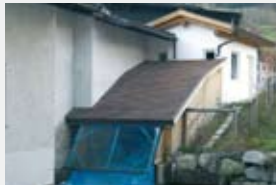
1400 l/s 2,00 m 18,20 kW