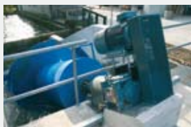
1300 l/s 0,95 m 8,70 kW