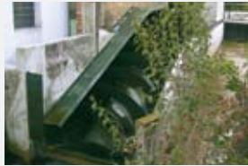
2000 l/s 2,61 m 37,70 kW