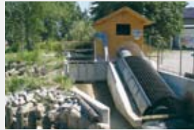
600 l/s 1,40 m 5,90 kW