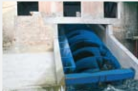
3000 l/s 2,78 m 62,20 kW