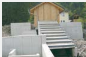
800 l/s 2,30 m 12,70 kW