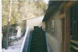
2300 l/s 4,20 m 69,00 kW