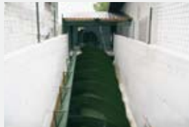
1575 l/s 2,60 m 29,30 kW