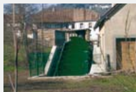
2000 l/s 4,00 m 58,30 kW