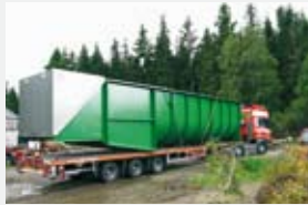
2400 l/s 3,65 m 65,00 kW