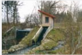
600 l/s 2,40 m 9,25 kW