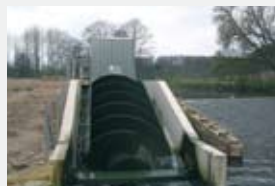
3150 l/s 1,25 m 26,80 kW